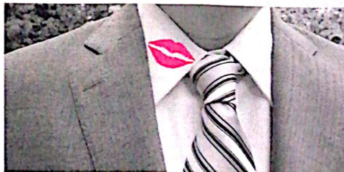
По статистици, дванаеста година брака – најризичнија