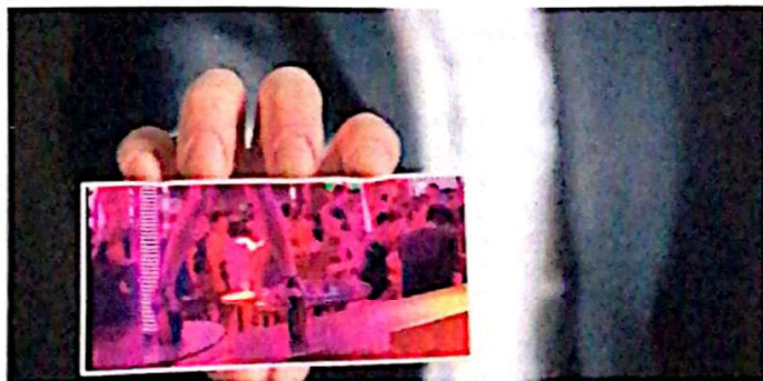
Детективи с полицијским искуством су најефикаснији

– Статистика коју водим говори ми да је дванаеста година